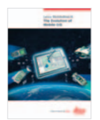
Leica MobileMatrix Produktbroschüre