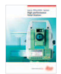
Leica TPS1200+ Produktbroschüre

Leica Geosystems AG Heerbrugg, Schweiz www.leica-geosystems.com