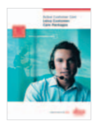
Leica Customer Care Packages Produktbroschüre

Abbildungen, Beschreibungen und technische Daten sind unverbindlich. Änderungen vorbehalten. Gedruckt in der Schweiz. Copyright Leica Geosystems AG, Heerbrugg, Schweiz, 2008. 768695de - VIII.08 - RDV