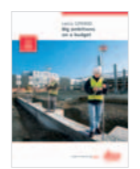
Leica GP5900 Produktbroschüre