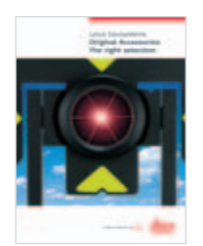
Leica Zubehör Produktbroschüre